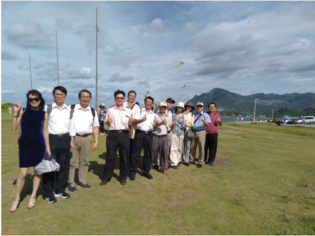
圖 6、與會人員午後海濱留影