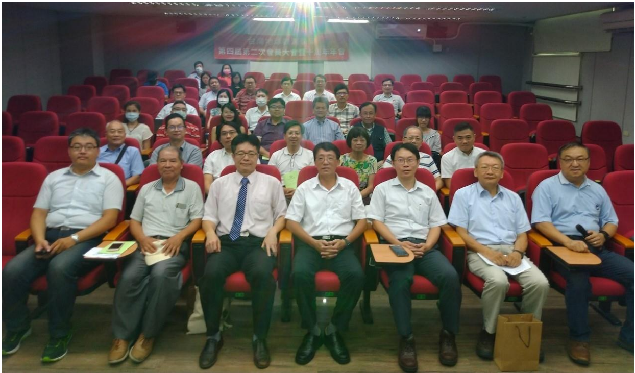
圖 4、與會人員之合影