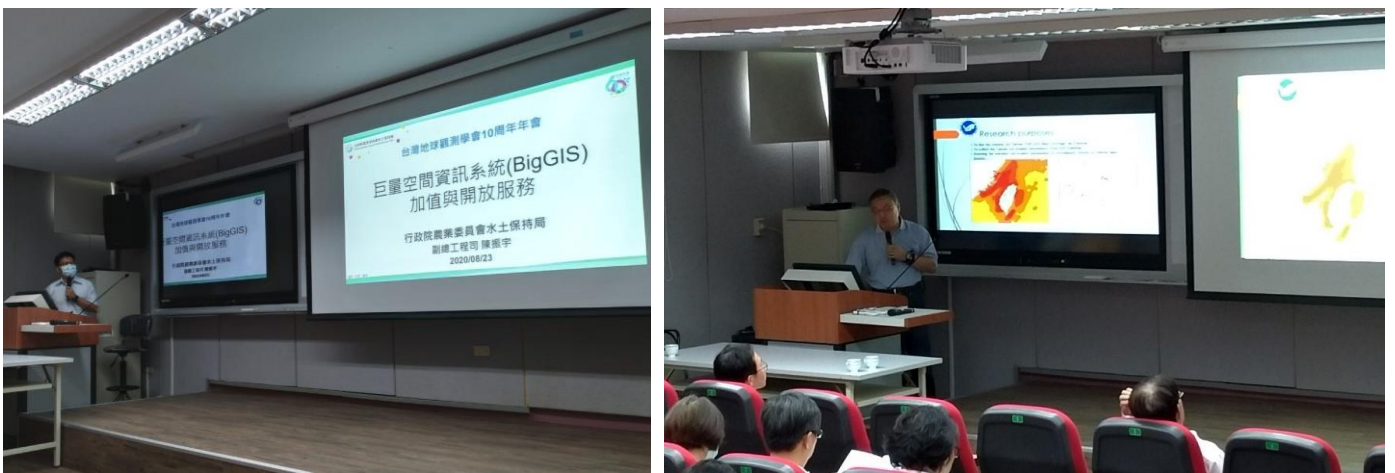
圖 3、十周年年會專題短講。