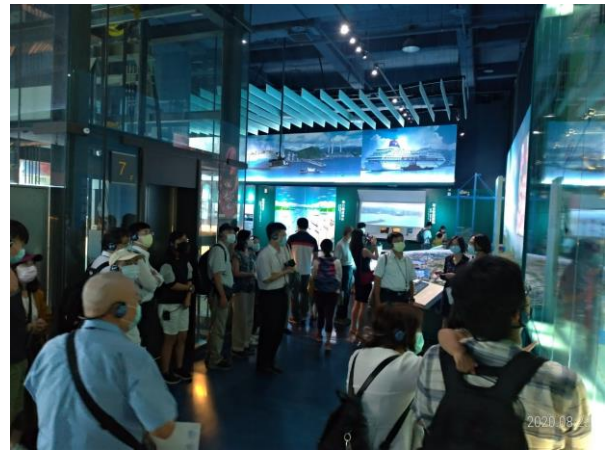
圖 5、參訪國立海洋科技博物館。